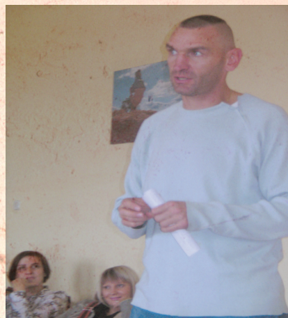
UGODNO I KORISNO-PREDAVANJE O SPORTU I POLJOPRIVREDI