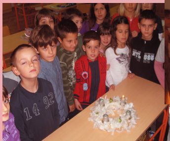
VESELJU NIJE BILO KRAJA