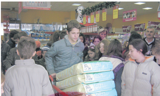
VOLJA I TRUD SU SVE ŠTO NAM TREBA