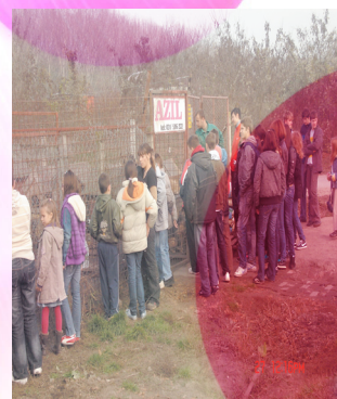
SRETNI I ZADOVOLJNI