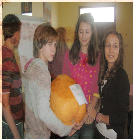
ZASLUŽENA POBJEDA ANĐELA