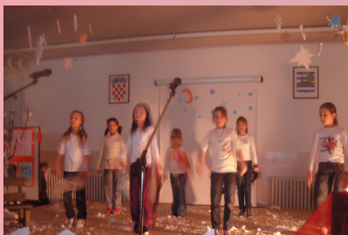
GOTOVO JE, JUPIII!!!