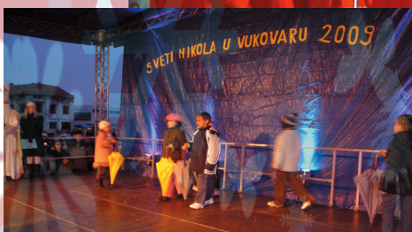
SVETI NIKOLA U NAŠEM GRADU